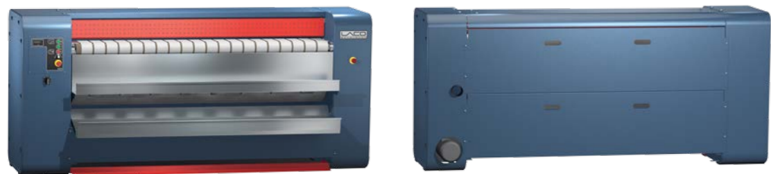
Slika: LACO valjak za glačanje M500, prednja strana (preuzimanje i izdavanje rublja)