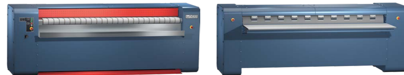
Slika: LACO valjak za glačanje D500, prednja strana (uvođenje rublja)